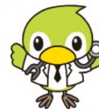
オリジナルキャラクター 健康すすめ君

伏見製薬といえば、 大腸CTのタギング製剤ですね！ (CTCメルマガVol.9参照)